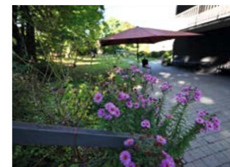
Ein Zuhause zum Wohlfühlen – umgeben von blühender Natur und liebevoll gestalteten Räumen.