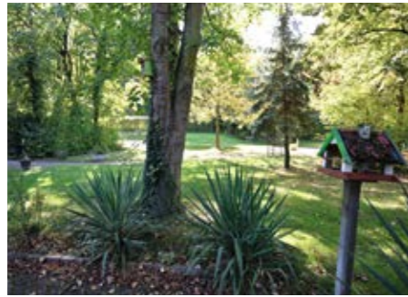
Unser Park – ein Ort der Ruhe.