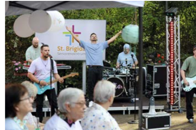
Musik verbindet Generationen.

Langweilig wird es meinen Eltern in St. Brigida nie. Und die regelmäßigen Feste machen allen großen Spaß und verbinden Generationen.