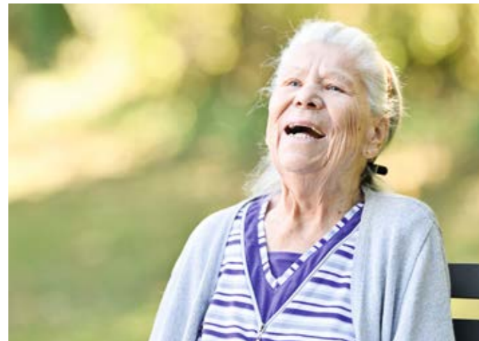
Sonnige Auszeit im Park.

Meine Mutter konnte noch viele schöne Jahre in St. Brigida verbringen. Und auch wir als Angehörige fühlten uns in jeder Betreuungsphase liebevoll aufgenommen.