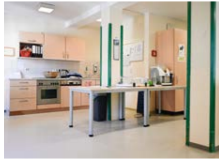
Eine offene Küche als Ort der Begegnung und Teilhabe.