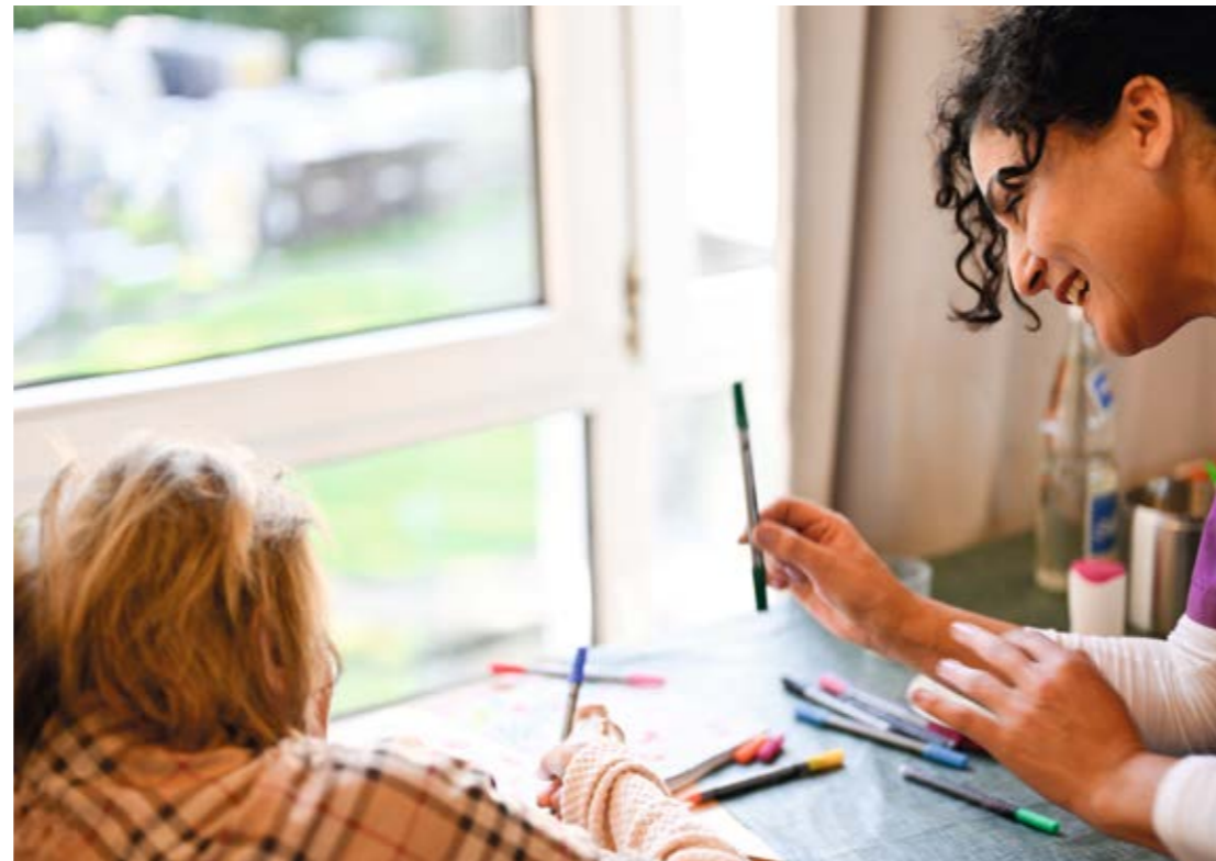
Gemeinsam statt einsam.