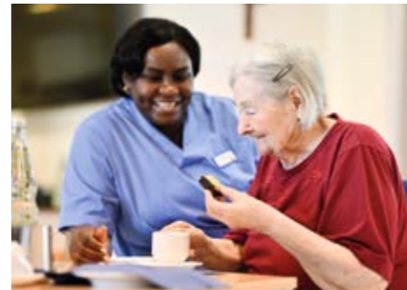
Kaffee, Kuchen und gute Gesellschaft – so schmeckt Gemeinschaft.