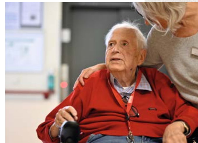
Nähe, die gut tut.