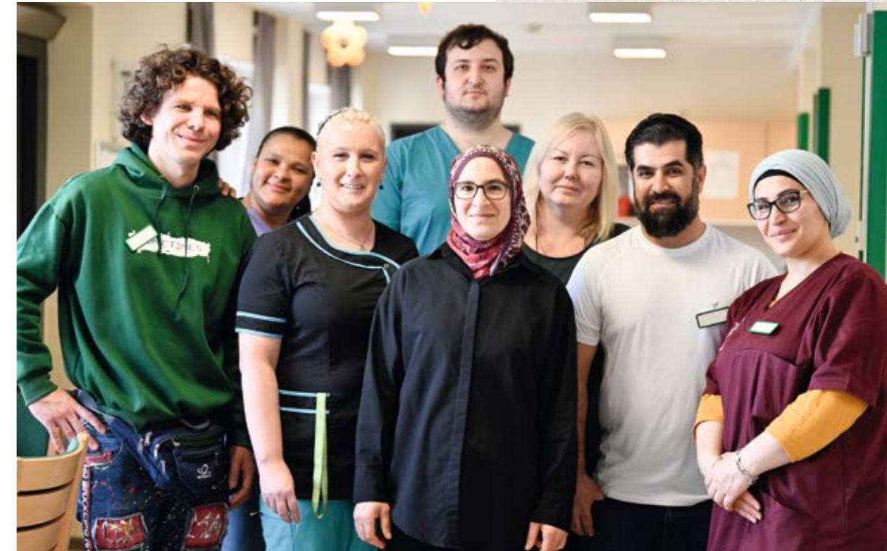
Team Wohnbereich 4 – St. Elisabeth.