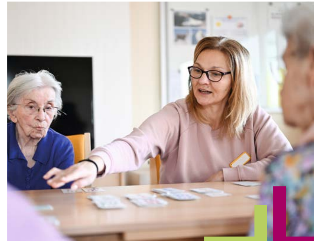
Spiel, Spaß und Gemeinschaft.