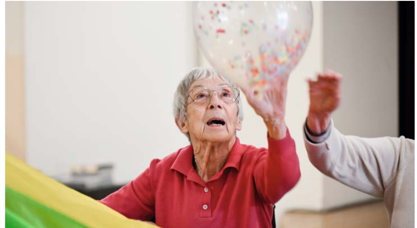
Bewegung im Leben.

Meine Mutter fühlt sich hier sehr wohl und von Beginn an wurden wir als Familie mit unseren Wünschen und Ängsten mitgedacht.