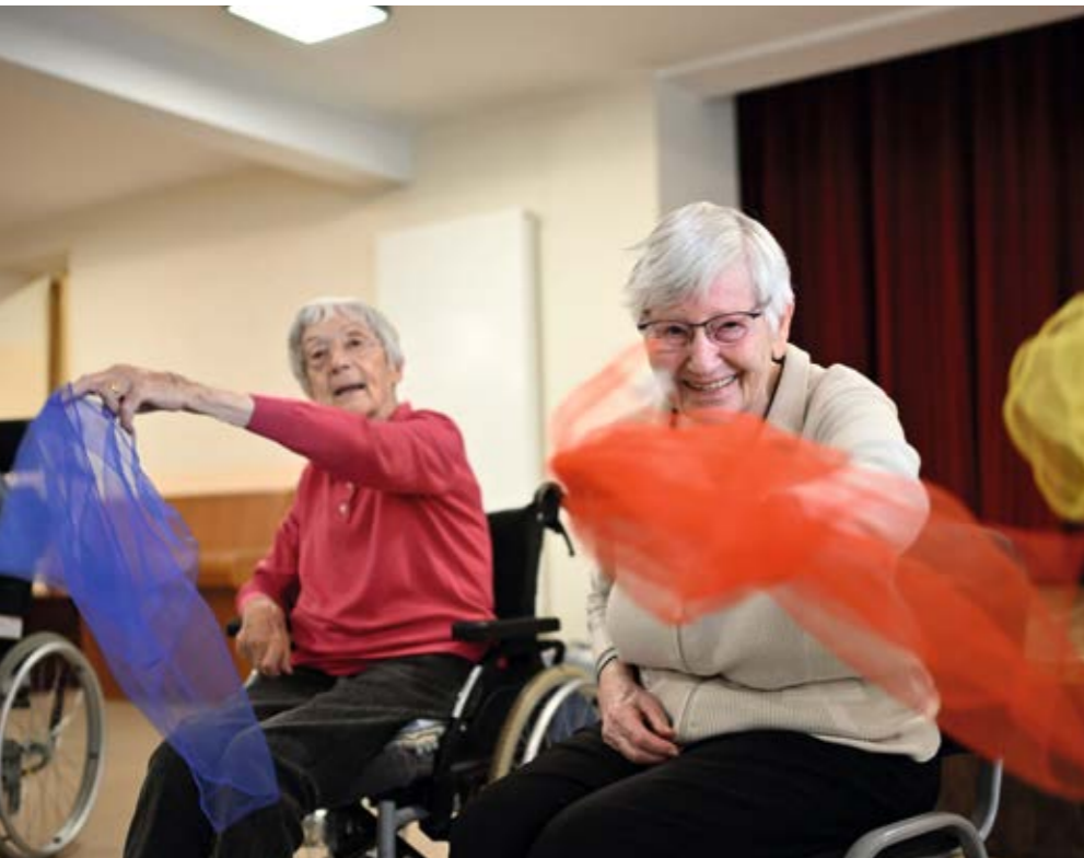
Aktiv bleiben – in jedem Alter.