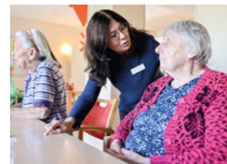
Generationen im Austausch.

Meine Mutter fühlt sich hier sehr wohl und von Beginn an wurden wir als Familie mit unseren Wünschen und Ängsten mitgedacht.